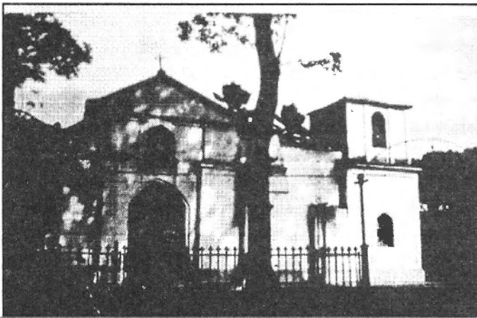
Imagen 2. Templo que visitó el Obispo Mariano Martí en Tinaquillo el 27 de febrero de 1781.

La iglesia estaba estructurada en una sola nave, desde la última grada del altar mayor hasta la puerta mayor tenía un largo de veinticuatro varas (2004cms), de ancho contenía nueve varas (751,5cms), excluyendo el grosor de las paredes y broqueles; las paredes estaban construidas sobre cimientos de cal y canto, los cuales salen sobre la tierra como media vara (41,75cms), en algunas partes y en otras menos; las paredes interiores se hallaban revocadas y encaladas lo que no poseían las de la parte exterior, las