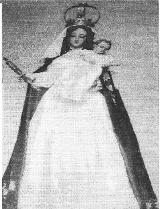
Imagen 3. Nuestra Señora del Socorro de Tinaquillo

ra del Socorro, patrona de la mencionada iglesia, dicha imagen se encontraba vestida para el momento de la visita con una cabacha (cual era una falda que usaban antiguamente en los Pirineos) y saya (cual es una prenda femenina antigua consistente en una especie de túnica que usaban los hombres), de persiana (tela de seda con varias flores tejidas y de diversidad de matices), con flores blancas y fondo verde, revestidos con cintas, manto de raso liso azul protegido de plata fina a manera de cinta, la imagen tenía una camisa elaborada en lino fino importado de Bretaña con encajes delicados; dicha imagen mide de alto vara y media (125,25cms), el torso, cara, brazos y manos son de escultura (talla), el resto de armazón; adornaban sobre dicha señora