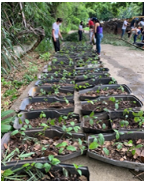
Fig. 1. Re-siembra de plántulas sobre cáscaras de lámparas urbanas desechadas por la Alcaldía de Chacao