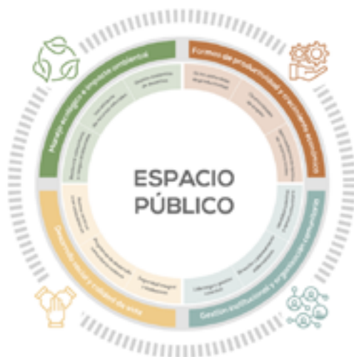
Fig. 3. Cuatro elementos fundamentales como pilares del desarrollo de proyectos comunitarios.

Desarrollo social y calidad de vida: acceso continuo a servicios básicos, programas de desarrollo comunitario continuos, seguridad integral y ciudadanía.