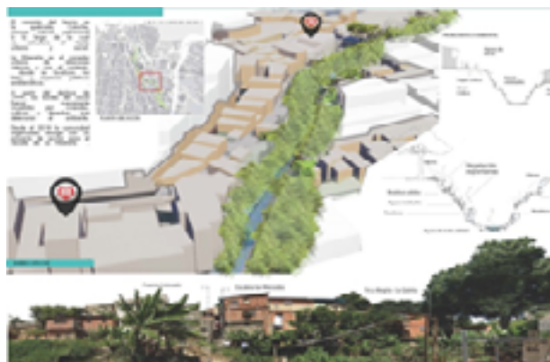
Fig. 7. Propuesta ganadora implementada por el equipo URBANLABORO.