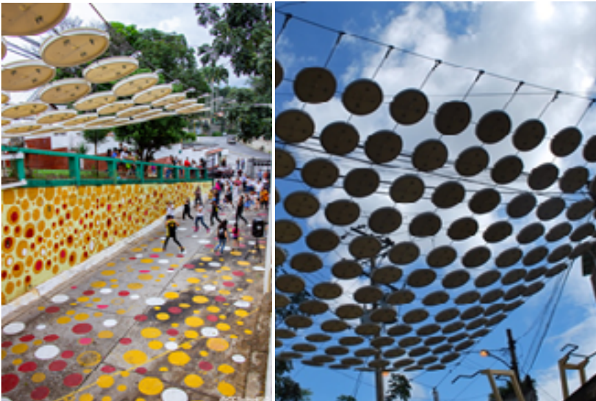
Fig. 16 y 17. El Güire. La reutilización de materiales para fines culturales y para propiciar sombra en escenarios de paso tenía el propósito de resignificarlos con arte.

Una comunidad dueña de sus tierras. El dueño de la hacienda dispuso dar en propiedad las tierras a todo aquel que trabajara dentro de sus tierras. La vialidad existente carecía sin embargo de espacios abiertos de reunión, para una comunidad muy cohesionada por el legado que recibieron alguna vez. Ideado con materiales reciclados, se ejecutó el diseño de un techo liviano, tensado con guayas metálicas entrelazadas con las tapas plásticas de tobos de pintura, con formas circulares, sobre una de las calles de la tríada que dan acceso a las distintas colinas con las viviendas de la comunidad. El arte y la vegetación complementan la propuesta con sombra, colorido y formas que dialogan con el techo. En este caso, la herencia recibida por una generación que ya comienza a desaparecer ejerce una fuerza cohesionadora importante para traspasar sus vivencias y su sentido de pertenencia e identidad al sitio.