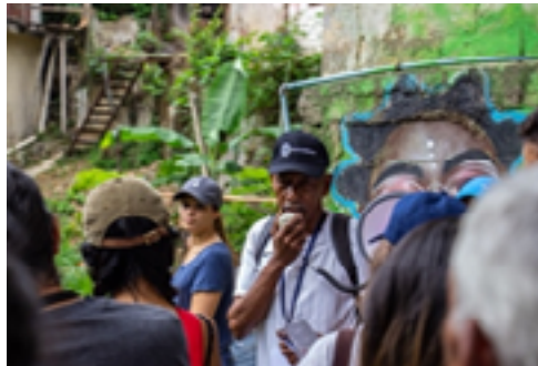
Fig. 5. Líderes comunitarios guían a los visitantes en las inmediaciones de su comunidad.