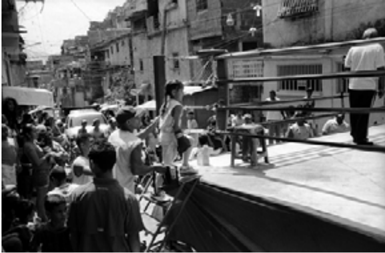
Fig. 20. Fotografías Ricardo Jiménez, 2015. El ring en la calle La Montañita. Fuente: Tesis doctoral MIP Sobre la naturaleza del vacío en tejidos urbanos autoproducidos. Caso de estudio: escuela de Boxeo Jairo Ruzza, José Félix Ribas 6, Petare Norte, Caracas