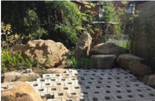
Fig. 9 y 10. Fabricación de adoquines con materiales locales de Catuche (piedras y arena de la quebrada). Mano de obra local (personas excluidas de trabajo y educación), sin producción de CO 2 , asesorados por la escuela de materiales de la UCV.