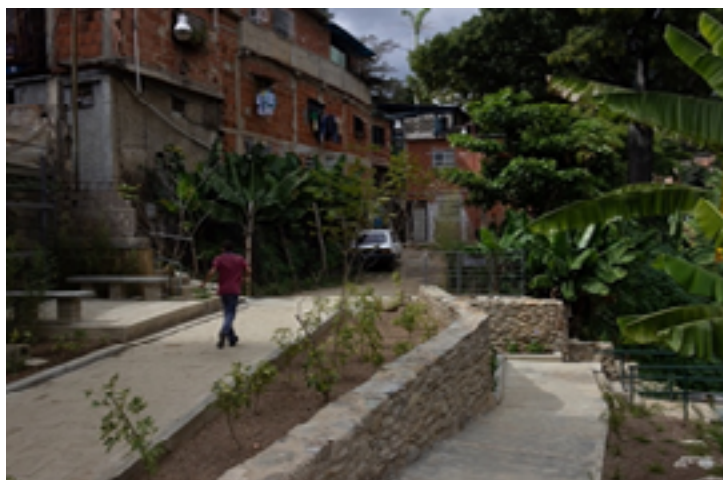
Fig. 8. Los pavimentos de acceso a las viviendas son de adoquines hechos en sitio.