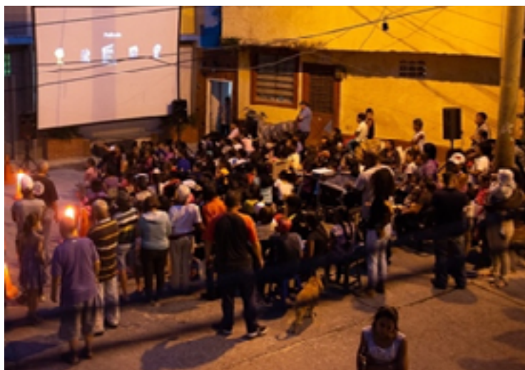
Fig. 15. El espacio de reunión frente a la escuela. La fachada luce una cruz y una campana como símbolos cohesionadores del sitio.

La escuela, la estructura diaria. La propuesta se desarrolla a lo largo de la quebrada que sale desde El Ávila y en forma de racimo alberga una gran cantidad de viviendas apiñadas, con poco espacio sobrante, casi siempre ocupado por automóviles. Una familia de hermanas educadoras, junto a su madre, una abuela de mucha vocación religiosa, se dieron a la tarea de educar a una comunidad completa muy desasistida, pero muy emprendedora. El espacio frontal de la escuela fue convertido en una plazoleta, donde ahora hay desde proyecciones de películas y cine foros, hasta misas en fechas conmemorativas, con los feligreses afuera, a cielo abierto. Las fachadas, el mobiliario urbano y las siembras de plantas constituyeron motivos centrales de la ejecución de una fachada que simultáneamente es altar, con una cruz y una campana embutida, y donde las paredes verdes son mantenidas por los niños junto a sus maestras a diario, en medio de grandes dificultades y escasez de servicios básicos como el agua. Sin embargo, se logró valorar el esfuerzo de lograr tener verde en los espacios comunes.