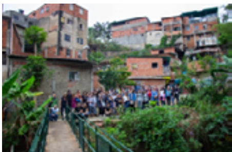
Fig. 6. Visitantes en uno de los varios recorridos técnicos en Catuche.