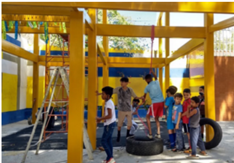
Fig. 19. La Vega. Reciclar estructuras en desuso. Lo lúdico como posibilidad para el encuentro. Lo verde como medio de educar para la sostenibilidad.

Se intervinieron diez comunidades, se realizaron dos concursos abiertos a profesionales de arquitectura, ingenierías y arte, hubo cincuenta equipos participantes, se realizaron diez seminarios y conferencias abiertas a todo público en modalidad mixta, se realizaron diez talleres con líderes comunitarios, diez visitas al sitio con comunidades y visitantes externos, alcanzamos a tener 450 participantes, cuarenta líderes comunitarios involucrados y logramos el apoyo de 175 instituciones aliadas.