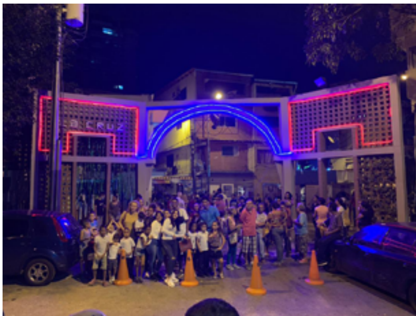
Fig. 13. Al proyecto del Bus TV, se sumó el proyecto Inside-Out con gigantografías de los residentes en las paredes contiguas al acceso al barrio. El arco de entrada se llenó de materos con plantas cuidadas por los niños.

noticias a viva voz en los espacios comunes y aprender a comunicar la información necesaria para beneficiar a su comunidad.