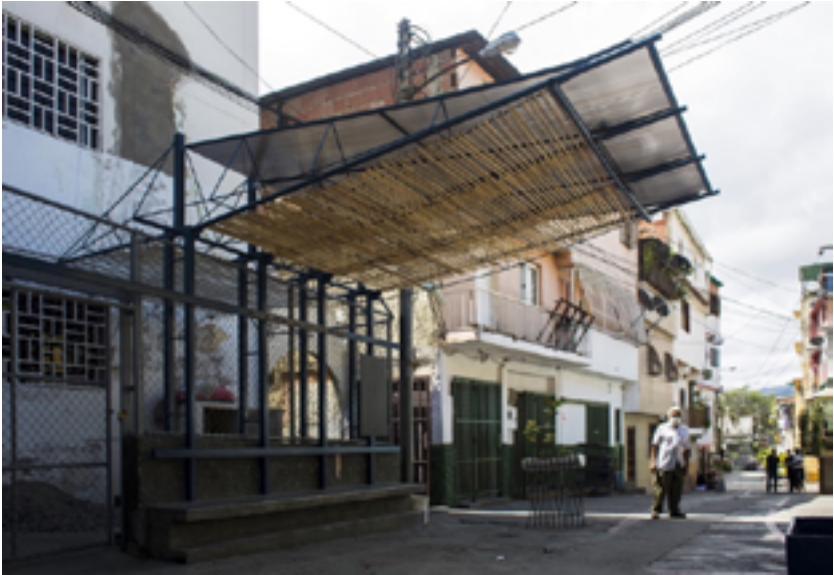
Fig.14. Techos livianos para tener sombra y despejar el bulevar como espacio de encuentro e intercambios entre grupos polarizados políticamente, en la comunidad de La Lucha.