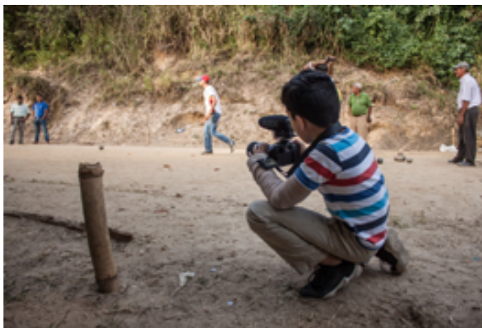
Fig.18. Niños y jóvenes aprendieron a manipular cámaras, aprender principios sobre cinematografía y documentalismo. Enseñarles a tener criterio, ser críticos y sensibles al ambiente, a la identidad local, a los rituales de su comunidad fue uno de los objetivos alcanzados.

Documentar con el teléfono. La colina que ocupa la comunidad de El Calvario se contrapone al damero colonial de El Hatillo, separado sólo por una calle, que llega desde la ciudad y se orienta hacia la urbanización La Lagunita. El proyecto ganador para esta zona estuvo conformado por un equipo de jóvenes cineastas, que se dieron a la tarea de enseñar a filmar a jóvenes de la comunidad de El Calvario hasta completar un “medio metraje” sobre los acontecimientos en su comunidad (eventos conmemorativos, religiosos, deportivos durante el COVID-19). Con razón, a la película la llamaron Ya no somos los mismos . Niños de doce años hasta jóvenes de diecisiete años aprendieron a manejar cámaras e implementos que les abrieron el mundo de la filmografía y el registro documental como oficio, a la vez de ratificar sus identidades locales y sus rituales cotidianos bajo la pandemia.