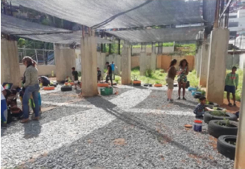
Fig. 12. Las mejoras abarcaron disminuir la incidencia del sol, superponiendo textiles sobre una estructura a medio hacer, para producir sombra y permitir la siembra de algunas plantas seleccionadas por la comunidad.

textiles propios de viveros, tensados en sentido vertical y horizontal, logrando superficies de sombra capaces de albergar actividades que oscilaban entre el mercado de ocasión, la siembra o las proyecciones de películas. La comunidad dividida por razones políticas paralizó el progreso de la obra, hasta lograr su culminación con la participación de los niños, que claramente querían un espacio de encuentro.