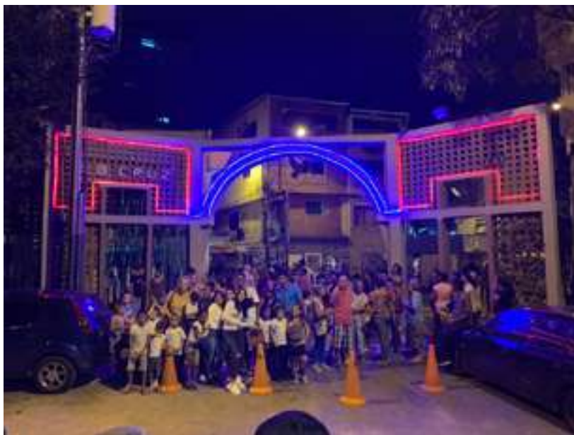
Fig. 13. Al proyecto del Bus TV, se sumó el proyecto Inside-Out con gigantografías de los residentes en las paredes contiguas al acceso al barrio. El arco de entrada se llenó de materos con plantas cuidadas por los niños.

noticias a viva voz en los espacios comunes y aprender a comunicar la información necesaria para beneficiar a su comunidad.