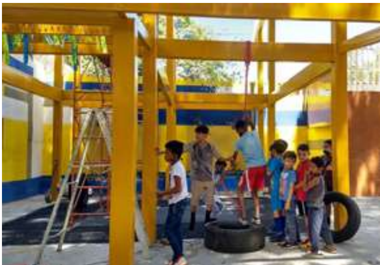
Fig. 19. La Vega. Reciclar estructuras en desuso. Lo lúdico como posibilidad para el encuentro. Lo verde como medio de educar para la sostenibilidad.

Se intervinieron diez comunidades, se realizaron dos concursos abiertos a profesionales de arquitectura, ingenierías y arte, hubo cincuenta equipos participantes, se realizaron diez seminarios y conferencias abiertas a todo público en modalidad mixta, se realizaron diez talleres con líderes comunitarios, diez visitas al sitio con comunidades y visitantes externos, alcanzamos a tener 450 participantes, cuarenta líderes comunitarios involucrados y logramos el apoyo de 175 instituciones aliadas.