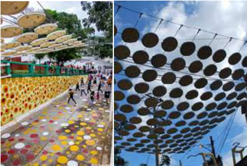
Fig. 16 y 17. El Güire. La reutilización de materiales para fines culturales y para propiciar sombra en escenarios de paso tenía el propósito de resignificarlos con arte.

Una comunidad dueña de sus tierras. El dueño de la hacienda dispuso dar en propiedad las tierras a todo aquel que trabajara dentro de sus tierras. La vialidad existente carecía sin embargo de espacios abiertos de reunión, para una comunidad muy cohesionada por el legado que recibieron alguna vez. Ideado con materiales reciclados, se ejecutó el diseño de un techo liviano, tensado con guayas metálicas entrelazadas con las tapas plásticas de tobos de pintura, con formas circulares, sobre una de las calles de la tríada que dan acceso a las distintas colinas con las viviendas de la comunidad. El arte y la vegetación complementan la propuesta con sombra, colorido y formas que dialogan con el techo. En este caso, la herencia recibida por una generación que ya comienza a desaparecer ejerce una fuerza cohesionadora importante para traspasar sus vivencias y su sentido de pertenencia e identidad al sitio.