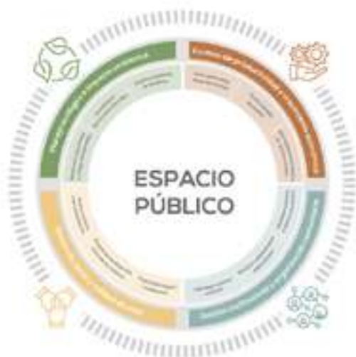
Fig. 3. Cuatro elementos fundamentales como pilares del desarrollo de proyectos comunitarios.

Desarrollo social y calidad de vida: acceso continuo a servicios básicos, programas de desarrollo comunitario continuos, seguridad integral y ciudadanía.