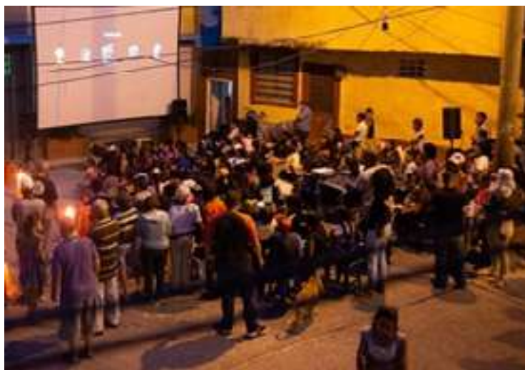
Fig. 15. El espacio de reunión frente a la escuela. La fachada luce una cruz y una campana como símbolos cohesionadores del sitio.

La escuela, la estructura diaria. La propuesta se desarrolla a lo largo de la quebrada que sale desde El Ávila y en forma de racimo alberga una gran cantidad de viviendas apiñadas, con poco espacio sobrante, casi siempre ocupado por automóviles. Una familia de hermanas educadoras, junto a su madre, una abuela de mucha vocación religiosa, se dieron a la tarea de educar a una comunidad completa muy desasistida, pero muy emprendedora. El espacio frontal de la escuela fue convertido en una plazoleta, donde ahora hay desde proyecciones de películas y cine foros, hasta misas en fechas conmemorativas, con los feligreses afuera, a cielo abierto. Las fachadas, el mobiliario urbano y las siembras de plantas constituyeron motivos centrales de la ejecución de una fachada que simultáneamente es altar, con una cruz y una campana embutida, y donde las paredes verdes son mantenidas por los niños junto a sus maestras a diario, en medio de grandes dificultades y escasez de servicios básicos como el agua. Sin embargo, se logró valorar el esfuerzo de lograr tener verde en los espacios comunes.