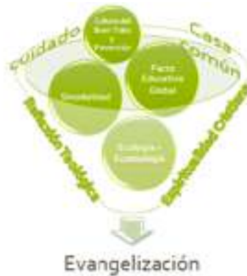
Figura 1: Relación entre teología, ecología, sinodalidad, educación, cultura de buen trato y evangelización.

Por último, se encuentra el término “ecología”, ya mencionado. Para la discusión siguiente, solamente se resalta uno de los aspectos ya tratados. La creación está llamada a vivir un equilibrio, el cual se rompe por el pecado. La conciencia de este equilibrio debe estar presente al momento del discernimiento, de manera que lo ecológico sea un elemento importante en el proceso de elegir. Partiendo de la necesidad de optar por lo bueno, dentro de un cosmos en el cual el ser humano se ubica como criatura, los parámetros de la ecología y de la ecoteología mueven a la persona a la sana relación con la creación, favoreciendo su cuidado y disponiéndola al verdadero servicio de la humanidad.