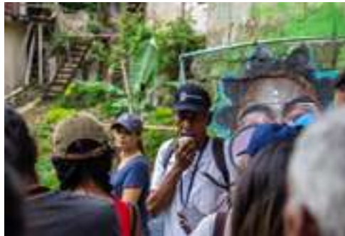
Fig. 5. Líderes comunitarios guían a los visitantes en las inmediaciones de su comunidad.