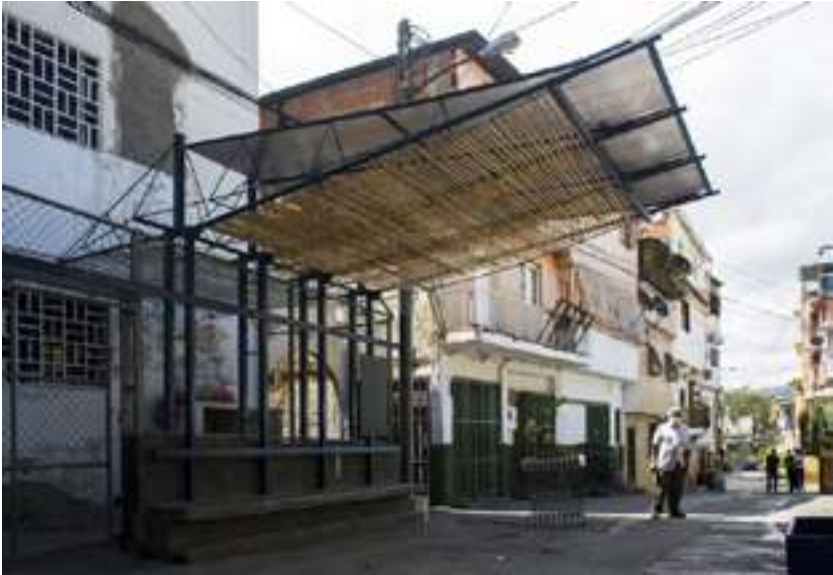
Fig.14. Techos livianos para tener sombra y despejar el bulevar como espacio de encuentro e intercambios entre grupos polarizados políticamente, en la comunidad de La Lucha.