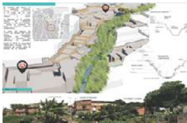
Fig. 7. Propuesta ganadora implementada por el equipo URBANLABORO.