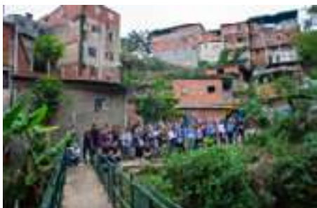
Fig. 6. Visitantes en uno de los varios recorridos técnicos en Catuche.