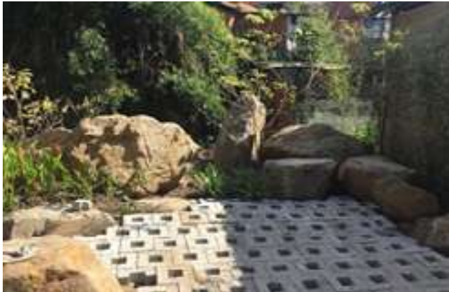
Fig. 9 y 10. Fabricación de adoquines con materiales locales de Catuche (piedras y arena de la quebrada). Mano de obra local (personas excluidas de trabajo y educación), sin producción de CO 2 , asesorados por la escuela de materiales de la UCV.