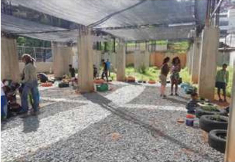
Fig. 12. Las mejoras abarcaron disminuir la incidencia del sol, superponiendo textiles sobre una estructura a medio hacer, para producir sombra y permitir la siembra de algunas plantas seleccionadas por la comunidad.

textiles propios de viveros, tensados en sentido vertical y horizontal, logrando superficies de sombra capaces de albergar actividades que oscilaban entre el mercado de ocasión, la siembra o las proyecciones de películas. La comunidad dividida por razones políticas paralizó el progreso de la obra, hasta lograr su culminación con la participación de los niños, que claramente querían un espacio de encuentro.