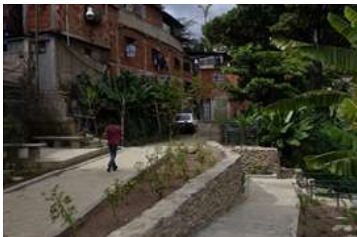
Fig. 8. Los pavimentos de acceso a las viviendas son de adoquines hechos en sitio.