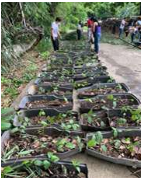
Fig. 1. Re-siembra de plántulas sobre cáscaras de lámparas urbanas desechadas por la Alcaldía de Chacao