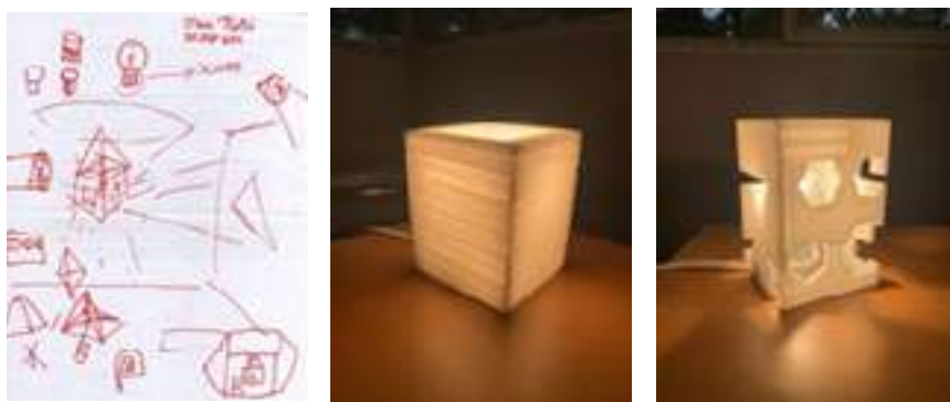
Fig. 11. Diseños de los niños y modelos impresos con plotter 3D.

Apostar por los más jóvenes. La educación de los más jóvenes en una comunidad extremadamente polarizada políticamente nos llevó a darles herramientas a aquellos con curiosidad por aprender, para también dejarles la responsabilidad -guiada- de seleccionar una acción concreta que beneficiara a todos. El diseño de lámparas urbanas para hacer más seguro el ambiente fue un logro de los niños de la comunidad (entre 8 y 17 años), empoderados con el manejo de dibujos de modelos realizados con resina en un plotter 3D.