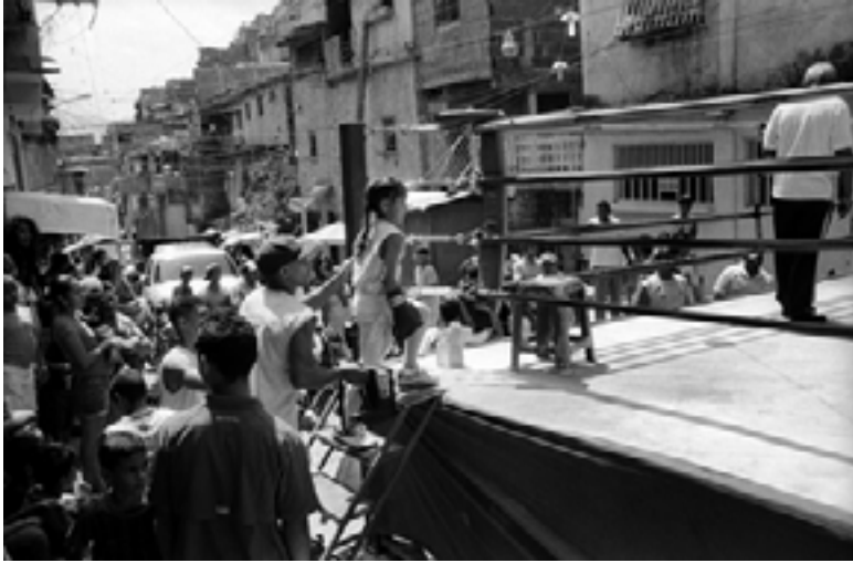
Fig. 20. Fotografías Ricardo Jiménez, 2015. El ring en la calle La Montañita. Fuente: Tesis doctoral MIP Sobre la naturaleza del vacío en tejidos urbanos autoproducidos. Caso de estudio: escuela de Boxeo Jairo Ruzza, José Félix Ribas 6, Petare Norte, Caracas