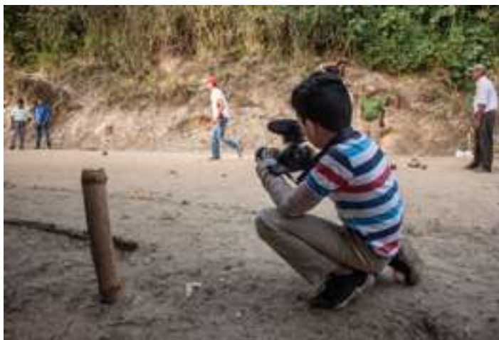
Fig.18. Niños y jóvenes aprendieron a manipular cámaras, aprender principios sobre cinematografía y documentalismo. Enseñarles a tener criterio, ser críticos y sensibles al ambiente, a la identidad local, a los rituales de su comunidad fue uno de los objetivos alcanzados.

Documentar con el teléfono. La colina que ocupa la comunidad de El Calvario se contrapone al damero colonial de El Hatillo, separado sólo por una calle, que llega desde la ciudad y se orienta hacia la urbanización La Lagunita. El proyecto ganador para esta zona estuvo conformado por un equipo de jóvenes cineastas, que se dieron a la tarea de enseñar a filmar a jóvenes de la comunidad de El Calvario hasta completar un “medio metraje” sobre los aconteceres en su comunidad (eventos conmemorativos, religiosos, deportivos durante el COVID-19). Con razón, a la película la llamaron Ya no somos los mismos . Niños de doce años hasta jóvenes de diecisiete años aprendieron a manejar cámaras e implementos que les abrieron el mundo de la filmografía y el registro documental como oficio, a la vez de ratificar sus identidades locales y sus rituales cotidianos bajo la pandemia.